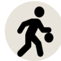
Basket 3 Vs 3