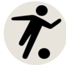
Foot 2 Vs 2